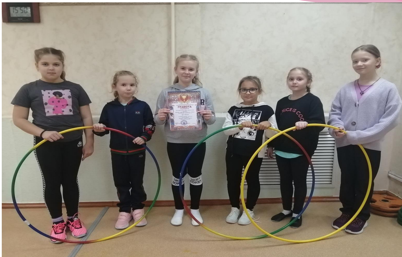
Городской конкурс «Физкульт- Привет» 2022 год, Грамота за 1 место