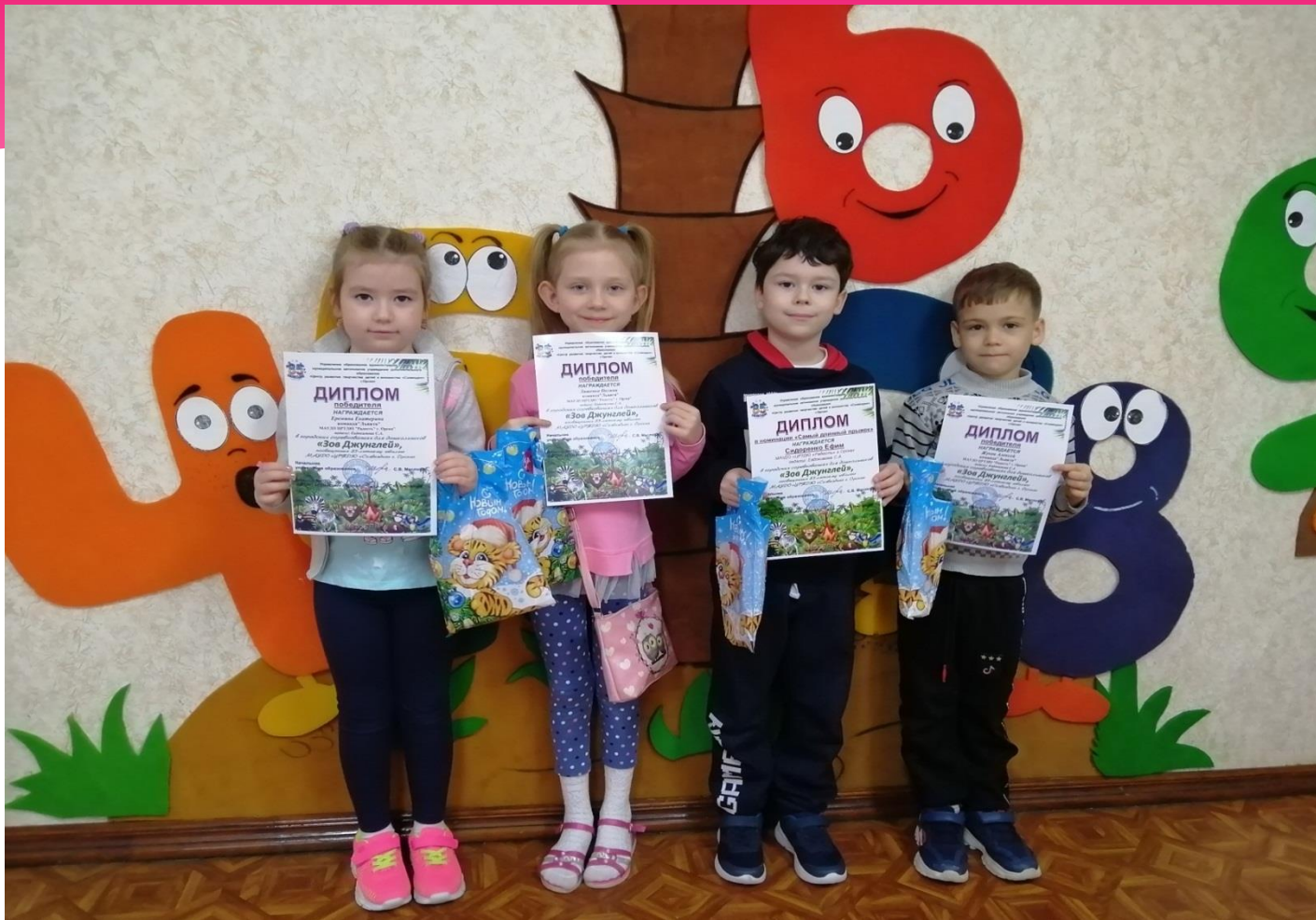
Городской конкурс «Зов Джунглей» 2022г. Диплом победителя 1 место