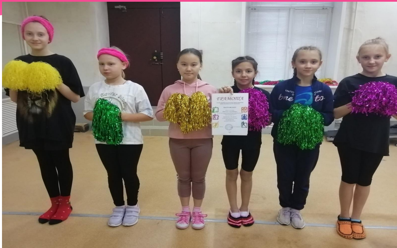
Областной конкурс «Здоровячок», 2022 год Грамота за 3 место.