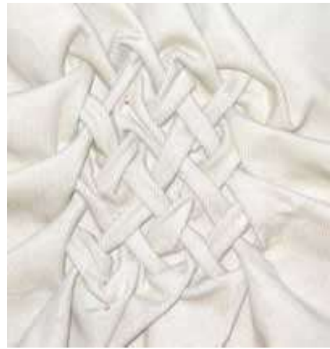
Фото готового образца